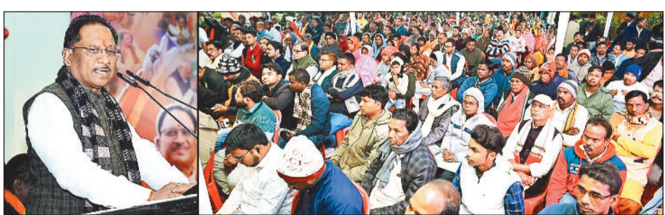
हरिभूमि न्यूज ►► जशपुरनगर

सुशासन सरकार के सफलतम दो वर्ष पूर्ण होने के उपलक्ष्य में मुख्यमंत्री विष्णुदेव साय ने बगिया स्थित अपने नेत्र निवास में आयोजित आमजनता एवं पत्रकारों के सम्मेलन को संबोधित