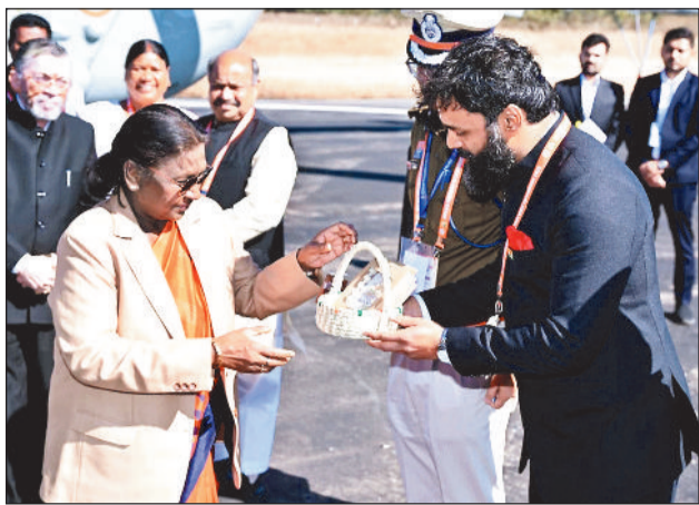
हरिभूमि न्यूज ►► जशपुरनगर

राष्ट्रपति श्रीमती द्रौपदी मुर्मू एवं मुख्यमंत्री विष्णु देव साय को जशक्राफ्ट ब्रांड के अंतर्गत स्थानीय प्राकृतिक संसाधनों-बांस एवं सवई घास से निर्मित आकर्षक हस्तशिल्प उत्पादों को पारंपरिक