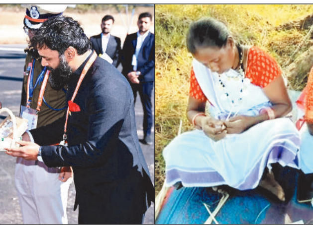
कलाकृतियों के रूप में उपहार स्वरूप भेंट किया गया।

राष्ट्रपति श्रीमती द्रौपदी मुर्मू एवं मुख्यमंत्री विष्णु देव साय को जशक्राफ्ट ब्रांड के अंतर्गत स्थानीय प्राकृतिक संसाधनों-बांस एवं सवई घास से निर्मित आकर्षक हस्तशिल्प उत्पादों को पारंपरिक